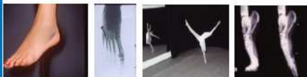
Fracture du pied, intervention, rééducation > Reprise danse